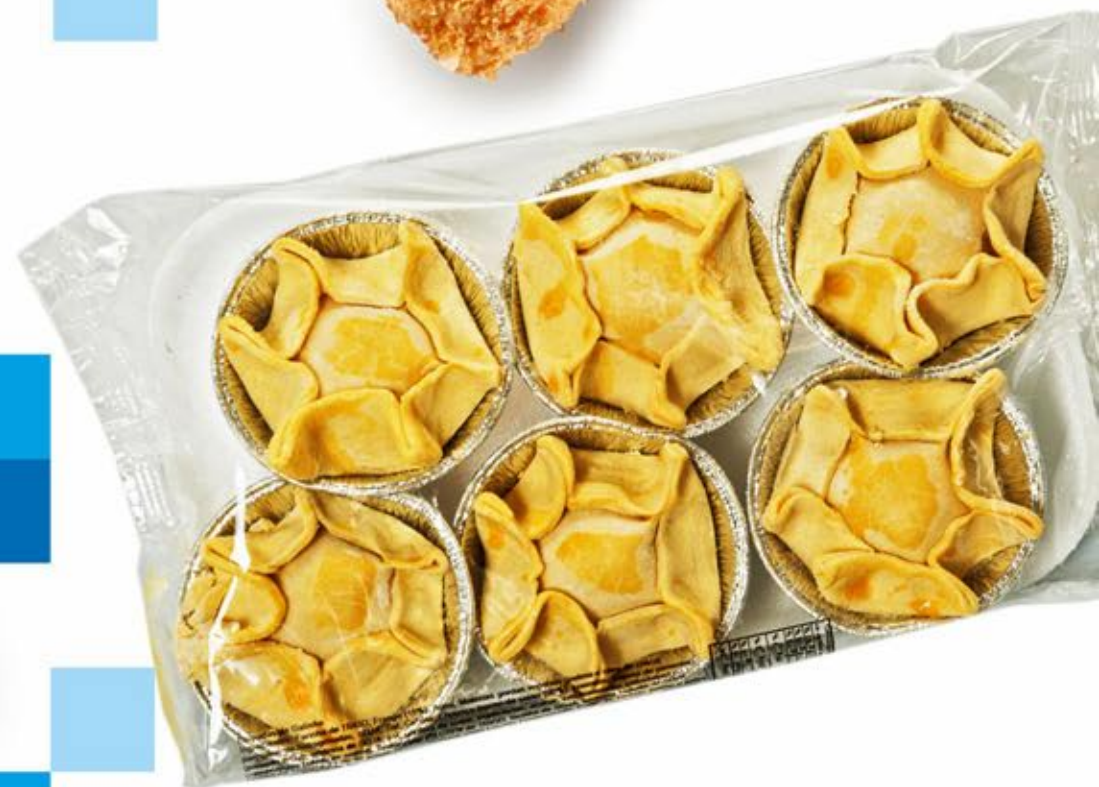
Empadas de Galinha