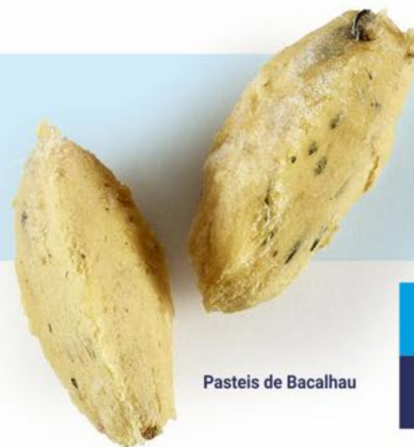
Pastéis de Bacalhau