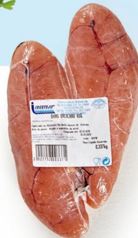
Ovas de Bacalhau