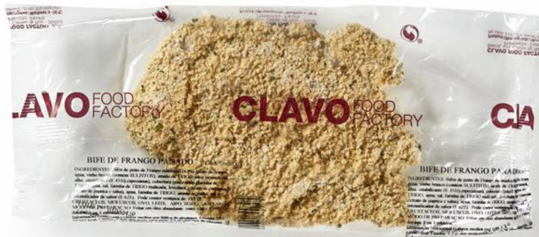
Bife de Frango Panado