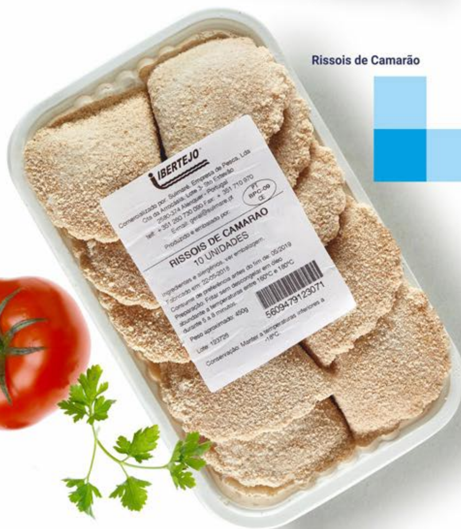
Rissois de Camarão