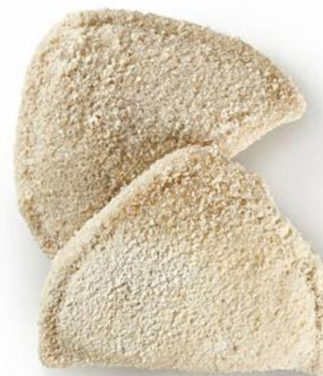
Rissois de Leitão