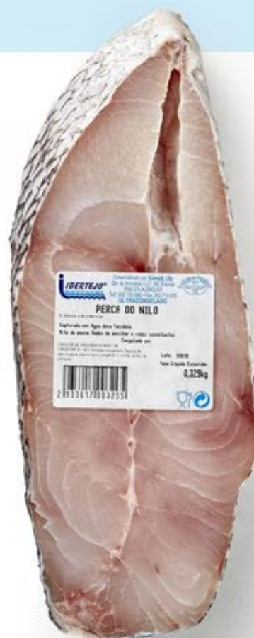
Perca do Nilo