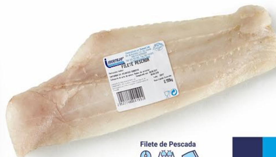
Filete de Pescada