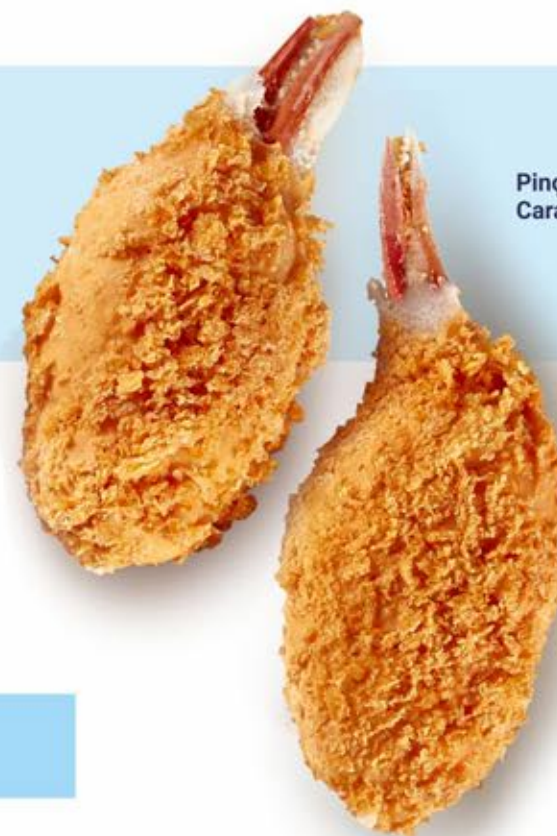
Pinças de Carangueijo