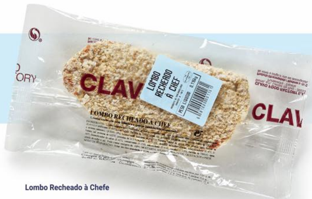
Lombo Recheado à Chefe